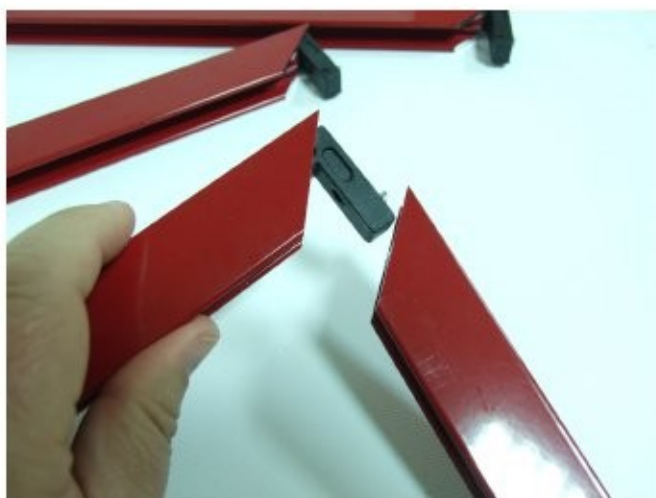
9 Inserire squadretti nel telaio