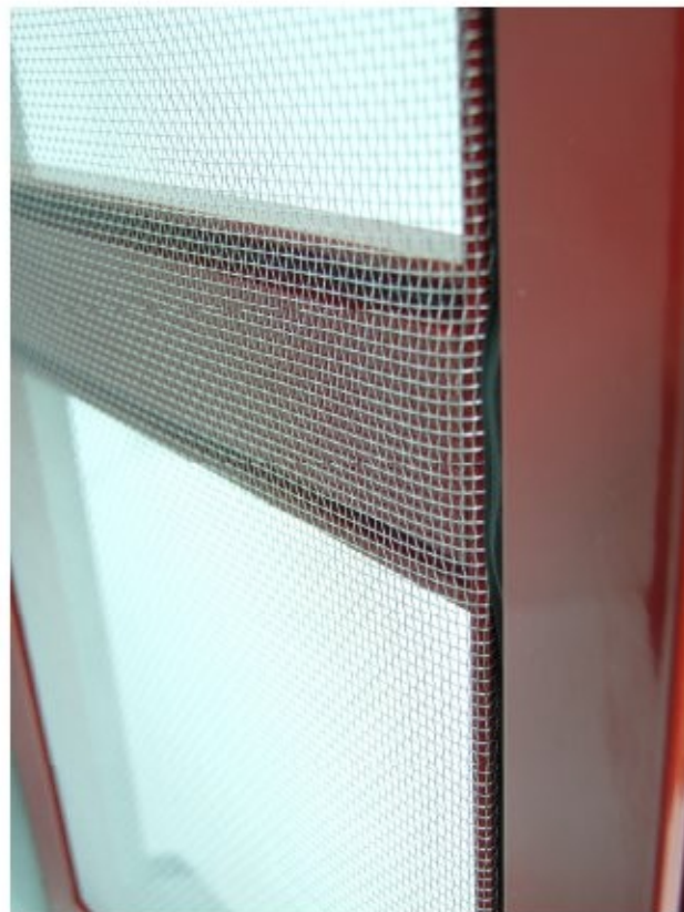
18 particolari rete in alluminio oppure fibra