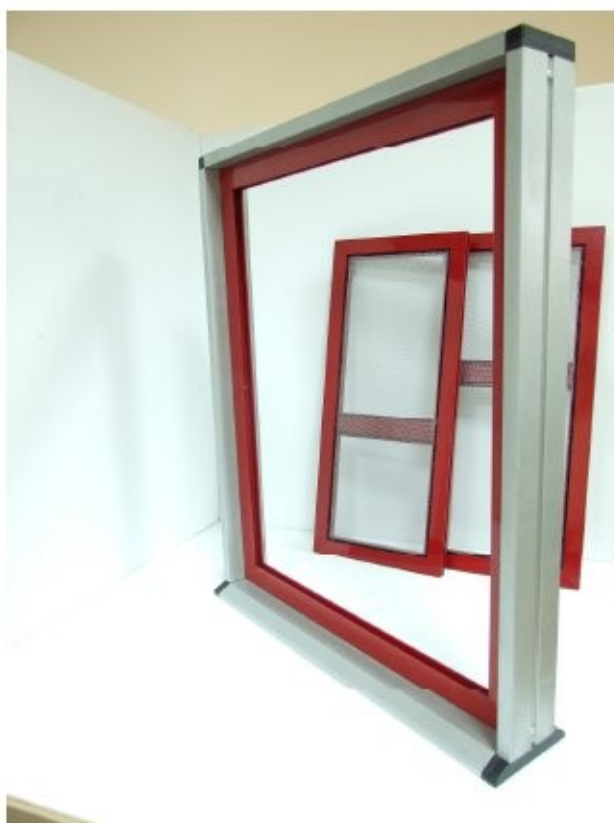
11 Presentare il telaio. Segnare e forare in 2/3 punti laterali