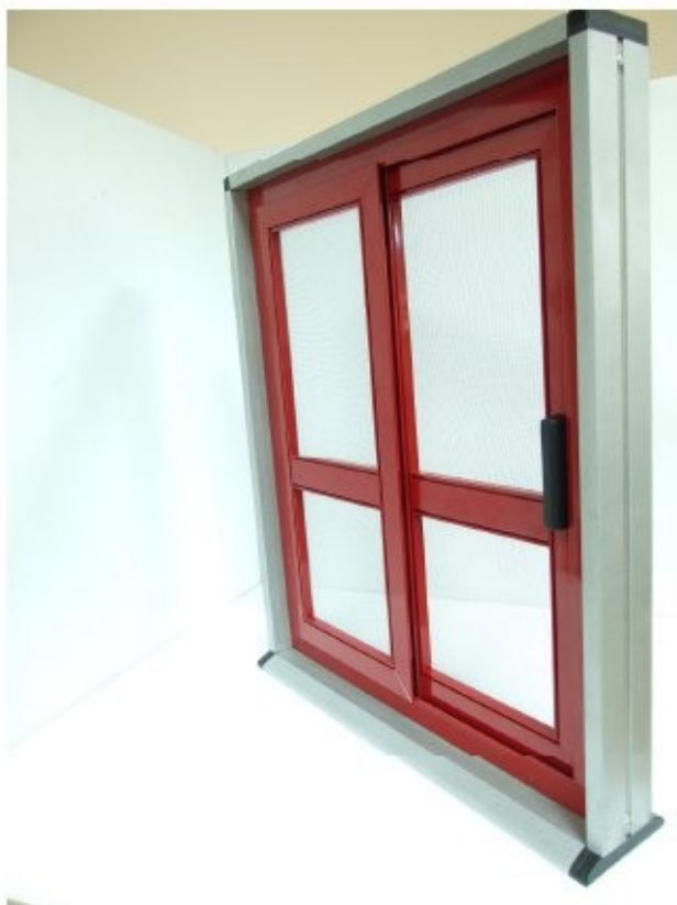
15 Giò Giò chiusa