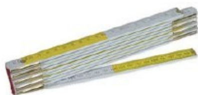
1 Metro per le misure