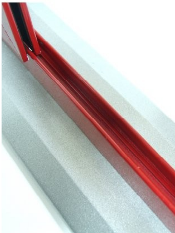
20 telaio disponibile a 2/3/4 ante