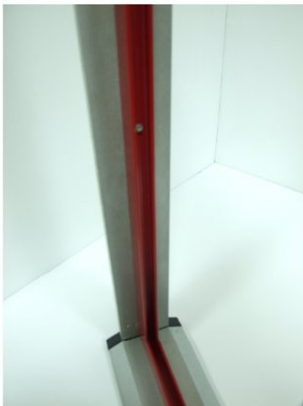
19 telaio in verticale