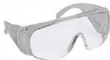
3 Occhiali protettivi