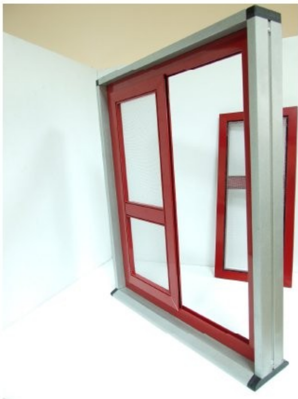
13 Inserito il pannello lato inferiore , Giò Giò già scorre