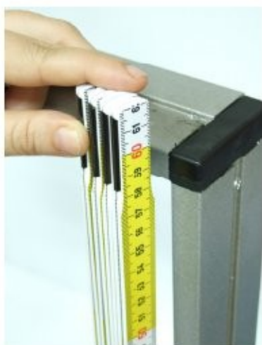
Misure lato dx

esempio sopra cm. 46.5, centro cm.46.3, sotto cm. 46.1 la misura da segnare e' cm.46,1