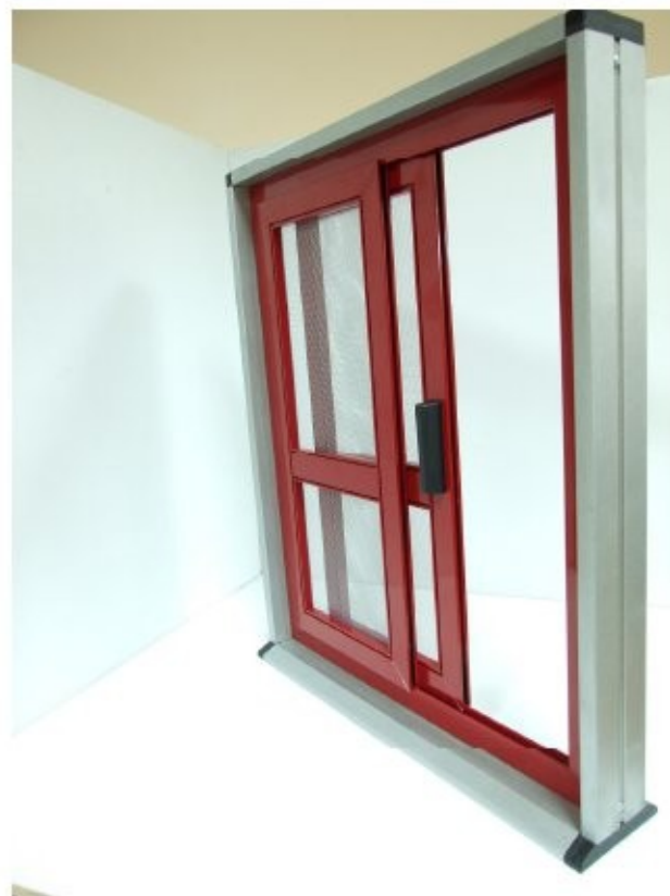
16 Giò Giò aperta