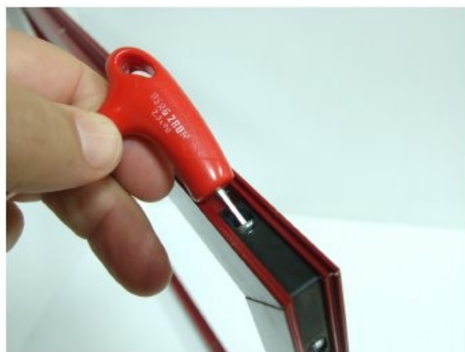
10 Avvitare con chiavino esagonale da mm2.5