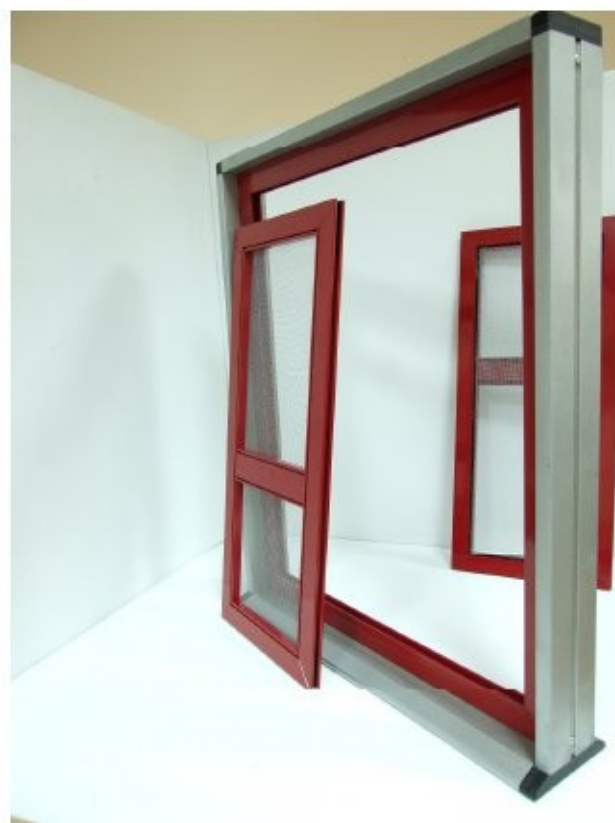
12 Inserire l'anta spingendo lato superiore alla guida