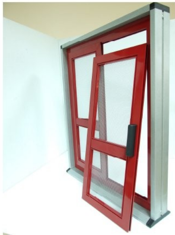
14 Stessa cosa per l'altro pannello