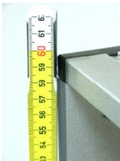
Misure lato sx