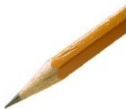
2 Matita per segnare