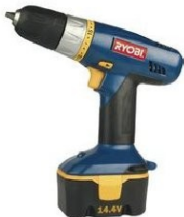
4 Trapano per forare/avvitare